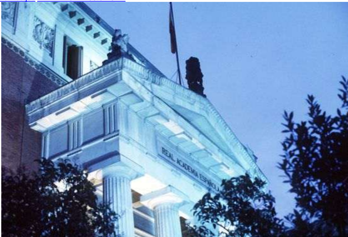
Fachada de la Real Academia Española de la Lengua

1. En los últimos años se han publicado en España numerosas guías de lenguaje no sexista. Han sido editadas por universidades, comunidades autónomas, sindicatos, ayuntamientos y otras instituciones. Las que identifico con siglas o abreviaturas en la relación que aparece al final constituyen tan solo una muestra de ese extenso catálogo. Antepondré un guion a la página citada: MUR-8 , UPM-10 , UGT-14 , etc.