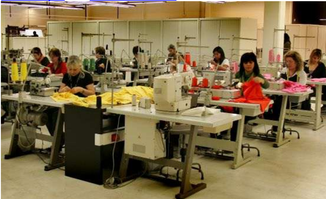
La desigualdad salarial se mantiene en todos los sectores. / Tejederas

María R. Sahuquillo Madrid 22 FEB 2012 - 14:43 CET8