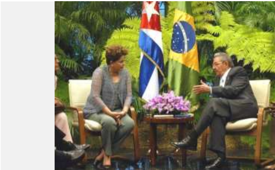
La presidenta brasileña junto al presidente cubano, Raúl Castro

Los grandes medios han mentido acerca de la reciente visita de la presidenta de Brasil, Dilma Rousseff , a Cuba (1). En incontables titulares leemos que ésta, durante la visita, “evitó hablar”, “eludió el tema” o “se negó” a abordar el asunto de los derechos humanos (2).